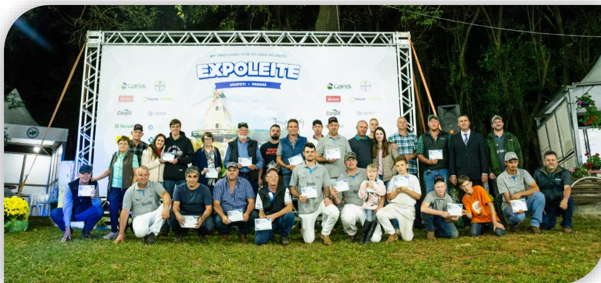
47ª Expoleite Arapoti – 2019

O sucesso dos produtores também agrega ao trabalho da Capal. “Para a Cooperativa, é muito bom, porque é uma forma de crescer cada vez mais em genética, produção, qualidade”, ressalta Rodrigo.