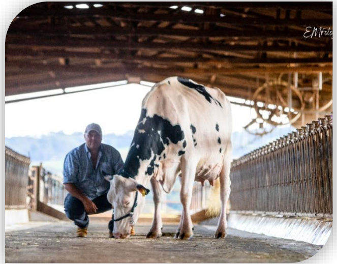
Grande Campeã 2019 Preto e Branco – HALLEY RUIVINHA DOORMAN 538 TE

Para ele, a participação em exposições é uma forma de dar visibilidade ao rebanho leiteiro. “A gente tem que colocar os animais à vista. Estar entre os melhores do Brasil é um mérito, mas a maior importância é levar o nome de Arapoti e da Capal, para que tenha contato e comércio com o pessoal de fora” , ressalta.