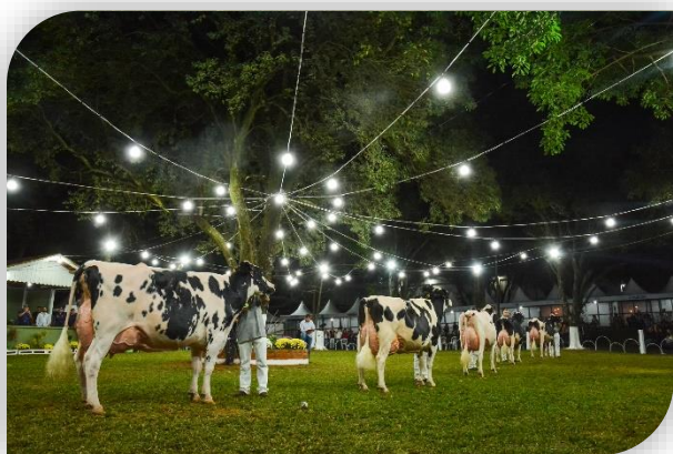
47ª Expoleite Arapoti – 2019

Premiação da ABCBRH destacou qualidade do rebanho de produtores associados à Capal