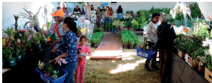
..... 48ª Expoleite sediará mais uma edição da Expo&Flor, organizada pelo Rotary Club

Além deles, outras instituições que estarão presentes neste ano com barracas na praça de alimentação são a APAE, com a venda de crepe e suco natural; o Lar dos Idosos com X-Pernil; a Creche Nosso Cantinho vai vender yakissoba e o Programa de Atendimento à Criança e ao Adolescente de Arapoti (PACAA) com cardápio