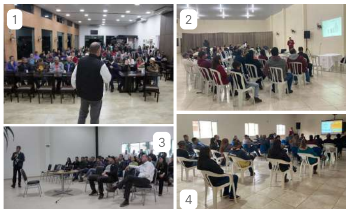
1 - Taquarituba; 2 - Wenceslau Braz; 3 - Taquarivaí; 4 - Santana do Itararé.

A prestação de contas e a abertura para sanar dúvidas aproxima os produtores associados à gestão da Cooperativa.