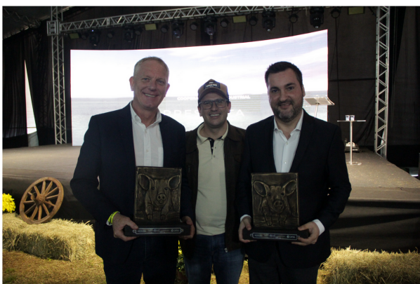
Imagens registradas durante a 48ª Expoleite

Em sua 6ª edição, o Encontro de Suinocultores deu início à programação da 49ª Expoleite, que até sábado (15) oferece um painel imersivo do agronegócio aos visitantes e produtores da região dos Campos Gerais. O encontro reuniu produtores cooperados da Capal. Eles participaram de palestras técnicas, uma oportunidade para trocar experiências e ampliar os conhecimentos sobre a cadeia produtiva, e também acompanharam técnicas para o preparo de carne suína.