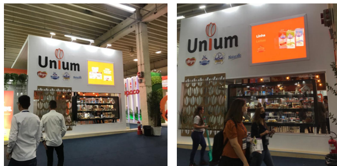
Estande da Unium na Mercosuper

Além da exposição nos produtos na feira, Auke Dijkstra Neto, representante da Unium, ressalta a importância de apresentar ao mer-