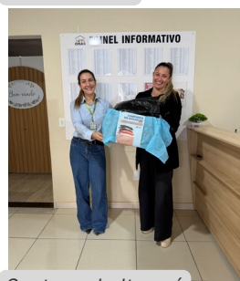
Santana do Itararé